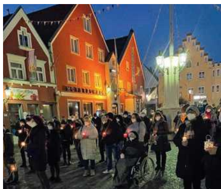
Der Asyl-Helferkreis Abensberg ruft montags zum „Licht für den Frieden“ am Stadtplatz auf.

Die Sonne kommt hervor, die ersten Veranstaltungen größerer Art können wieder stattfinden – die Zeichen sind positiv für unsere Feste, auf die wir lange verzichten mussten. Die IG Sandharlanden hat ihren Spargelmarkt für heuer noch abgesagt, was viele bedauerten. Angesichts der Vorlaufzeit, die für den Markt nötig ist, und der herrschenden Inzidenzen ist das aber durchaus verständlich. Wir haben unsere Bürgerversammlungen nicht umsonst in den Mai gelegt, nachdem wir sie zunächst schon im Februar durchführen wollten. Vorsicht ist immer noch das Gebot. Aber wir planen mit großer Freude unsere Veranstaltungen. Ein wichtiger Partner ist hierbei der Stadtverband, über den wir in der Heftmitte berichten.