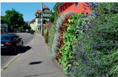
Beispiele für Dach- und Fassadenbegrünung.