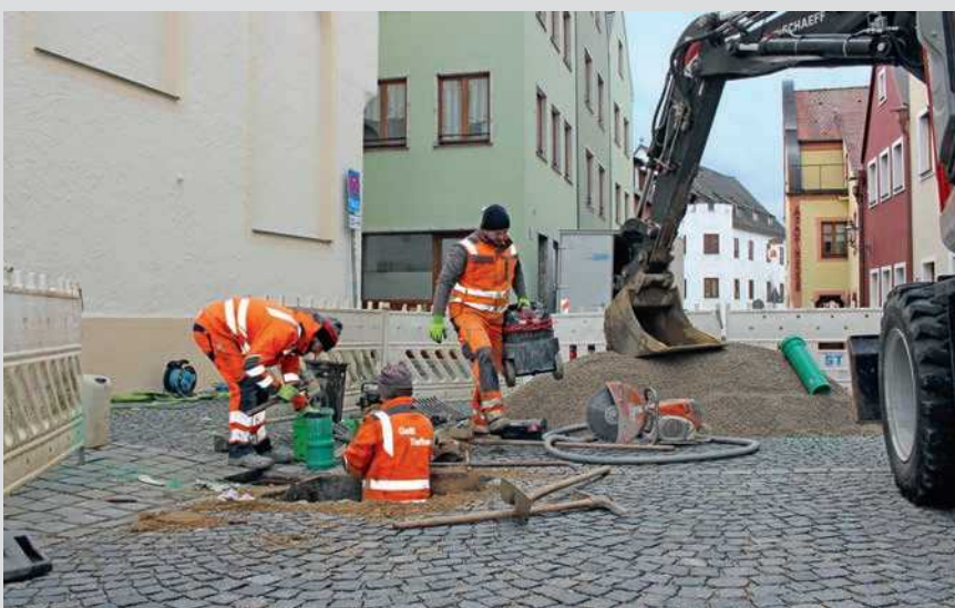
Die Stadtwerke Abensberg werden in diesem Jahr Kanalsanierungsarbeiten durchführen.