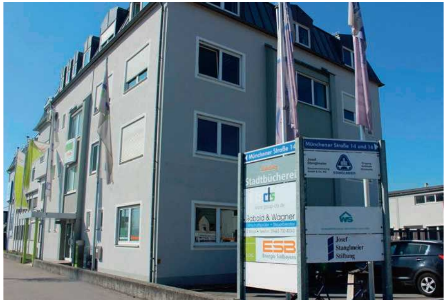
Die Stadtbücherei Abensberg in ihrem Übergangsdmizil in der Münchener Straße. Der Neubau am Barbaraplatz wurde vorläufig zurückgestellt.

Vor einem Jahr packten die fleißigen Helfer der Stadtbücherei Abensberg alle ihre Bücher und Medien ein und zogen in ihr neues Domizil in der Münchener Straße 14. Der Neubau der Bibliothek am alten Standort Barbaraplatz wurde im März 2021 einstimmig vorläufig zurück gestellt. Die Übergangslösung in der Münchener Straße bietet hellere und barrierefreie Räumlichkeiten. An diesem Standort hat die Stadtverwaltung gute Erfahrungen gemacht, als das Rathaus saniert worden ist – die Erreichbarkeit ist gut. Mit der großen Gillamooswiese gegenüber gibt es zahlreiche Parkmöglichkeiten. Auf der Rückseite des Gebäudes stehen fünf weitere Parkplätze zur Verfügung.