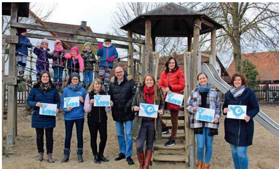
Die Anmeldung in den Kindergärten ist in Abensberg durch eine Online-Lösung einfacher als bisher.

Endlich können die Bürgerversammlungen wieder stattfinden. Die letzten haben wir 2019 durchgeführt, dann machte Corona allen einen Strich durch sämtliche Rechnungen. Ich bin sehr froh, dass dies nun anders wird. Mitte Mai starten die Bürgerversammlungen, wie üblich erfolgt der Auftakt in Abensberg. Dann geht es in unsere schönen Ortsteile. Ich lade Sie ein, Ihre Bürgerversammlung zu besuchen. Sie erhalten einen Überblick, was Ihre Stadtverwaltung macht, welche Schwerpunkte gesetzt werden, wie es um die Finanzen bestellt ist und vieles mehr.