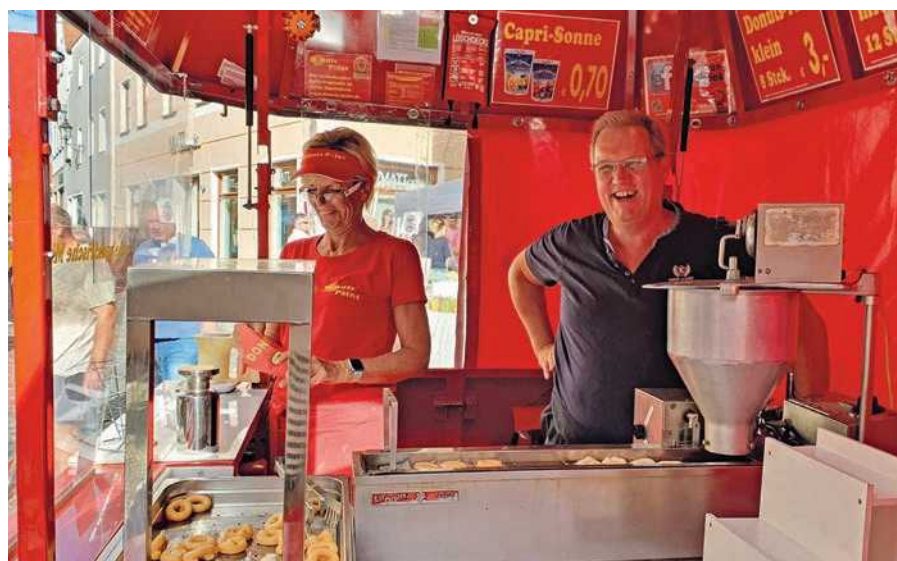
Frühjahrsmarkt in Abensberg am Sonntag, 10. April.