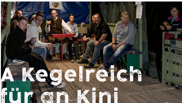
A Kegelreich für an Kini