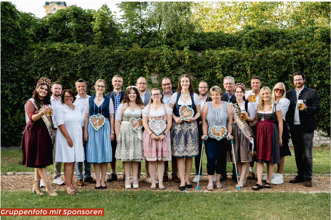
Gruppenfoto mit Sponsoren